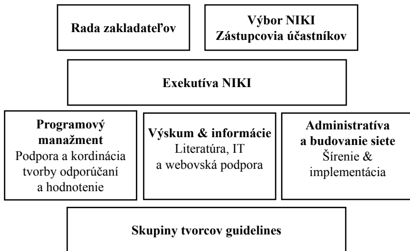
Obrázok 3-1 Štruktúra NIKI